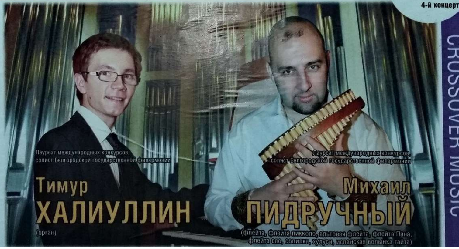
Лауреат международных конкурсов, солист Белгородской государственной филармонии